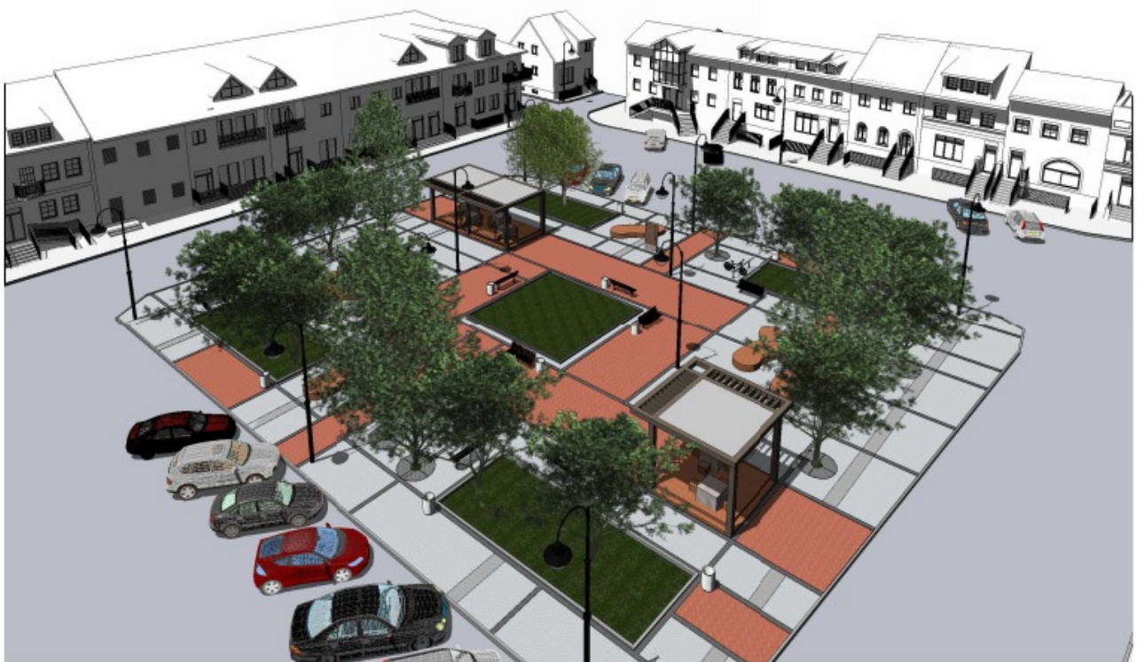
WIDOK Z GÓRY W KIERUNKU POŁUDNIOWO-WSCHODNIM