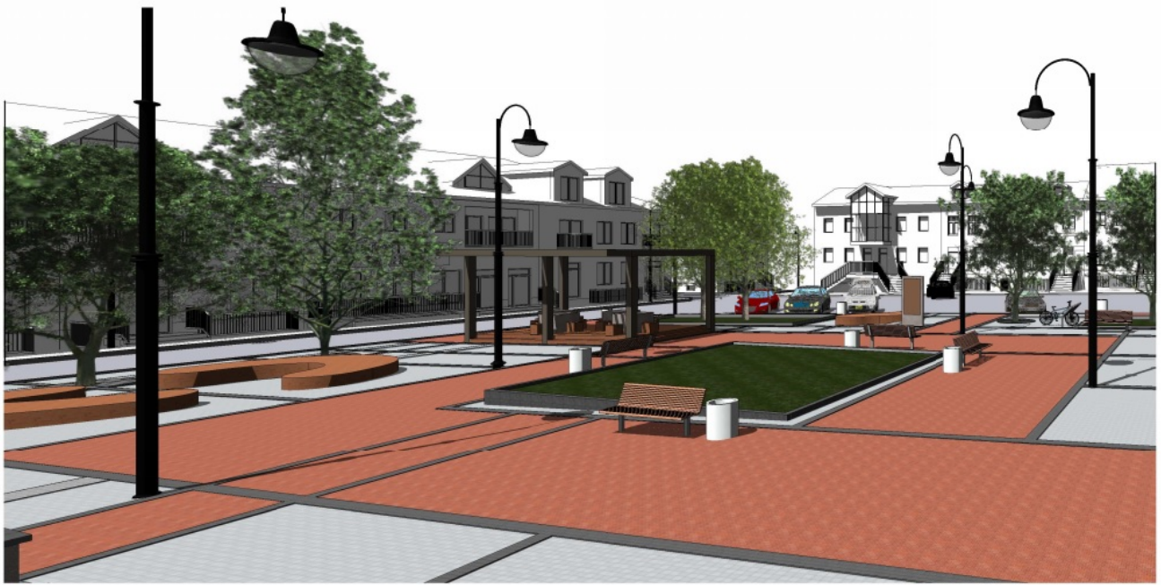
WIDOK W KIERUNKU WSCHODNIM