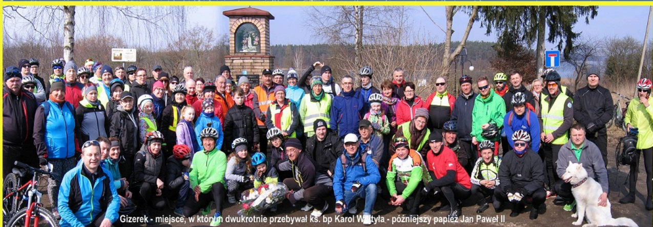
Gizerek - miejsce, w którym dwukrotnie przebywał ks. bp Karol Włodyka - późniejszy papież Jan Paweł II