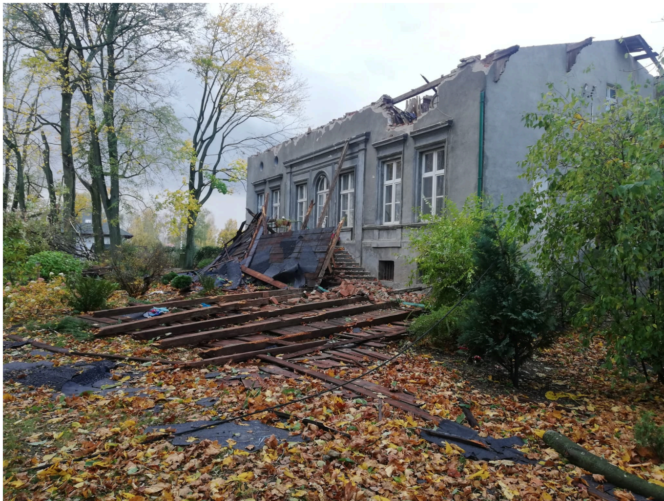
Klimy i Krzywka, to miejscowości, w których także doszło do uszkodzenia dachów.