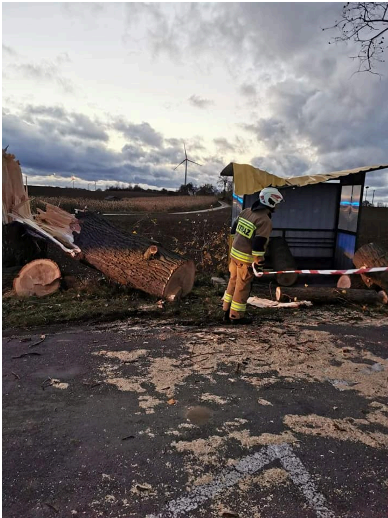
Bałoszyce i Jawty Wielkie, to miejsca, gdzie w gminie Susz była potrzebna pomoc strażaków.