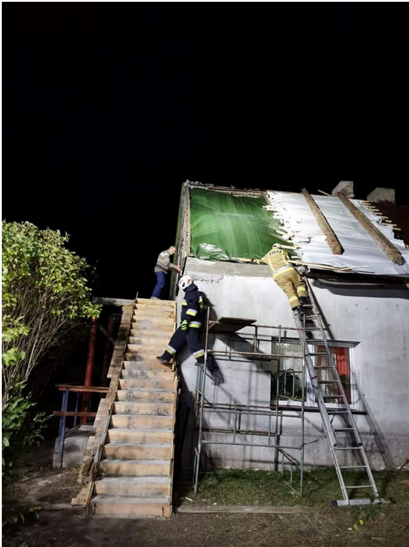
Wiatrołomy na lokalnych drogach. Doszło do uszkodzenia wiaty przystanku autobusowego.