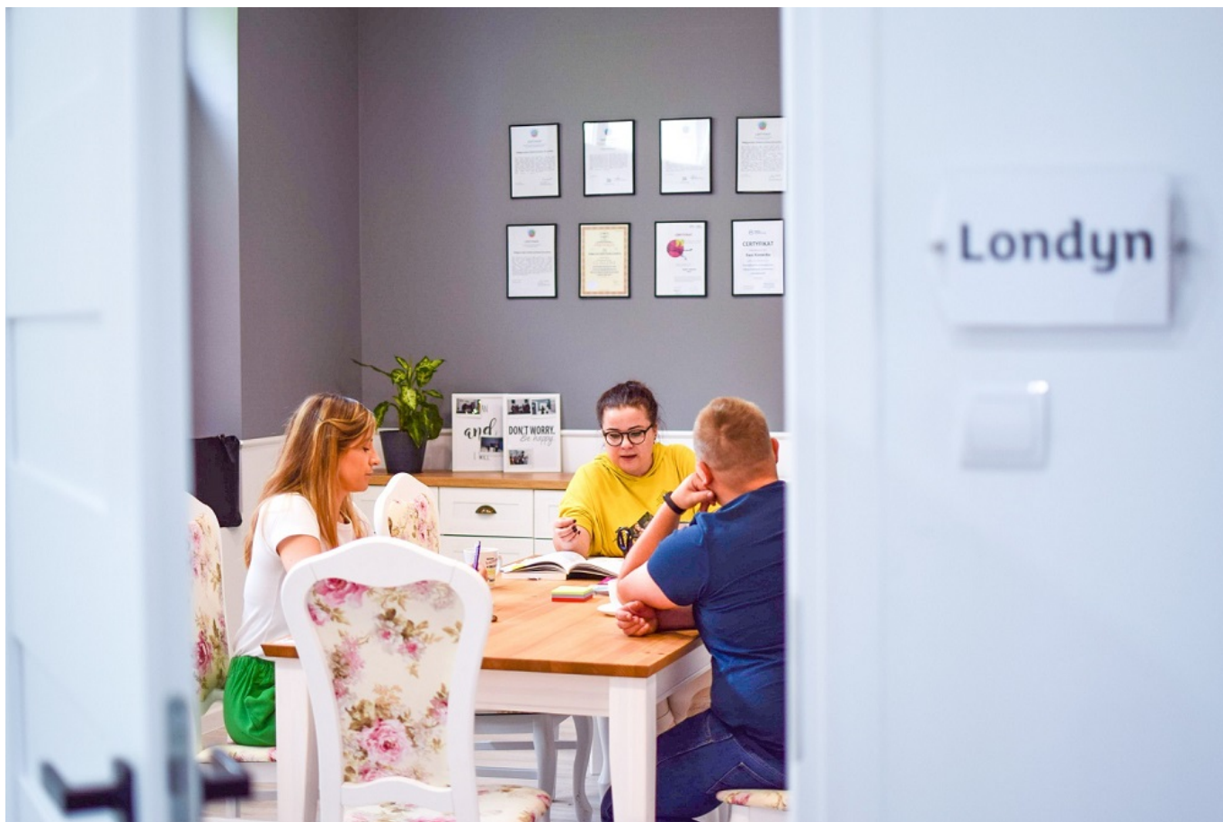
Szkoła mieści się w centrum miasta, na ulicy Sobieskiego.