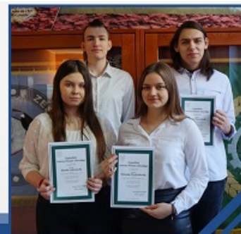
Stypendiści Starosty Ławskiego