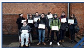
Laureatka Olimpiady Wiedzy i Umiejętności Rolniczych w bloku żywienia człowieka