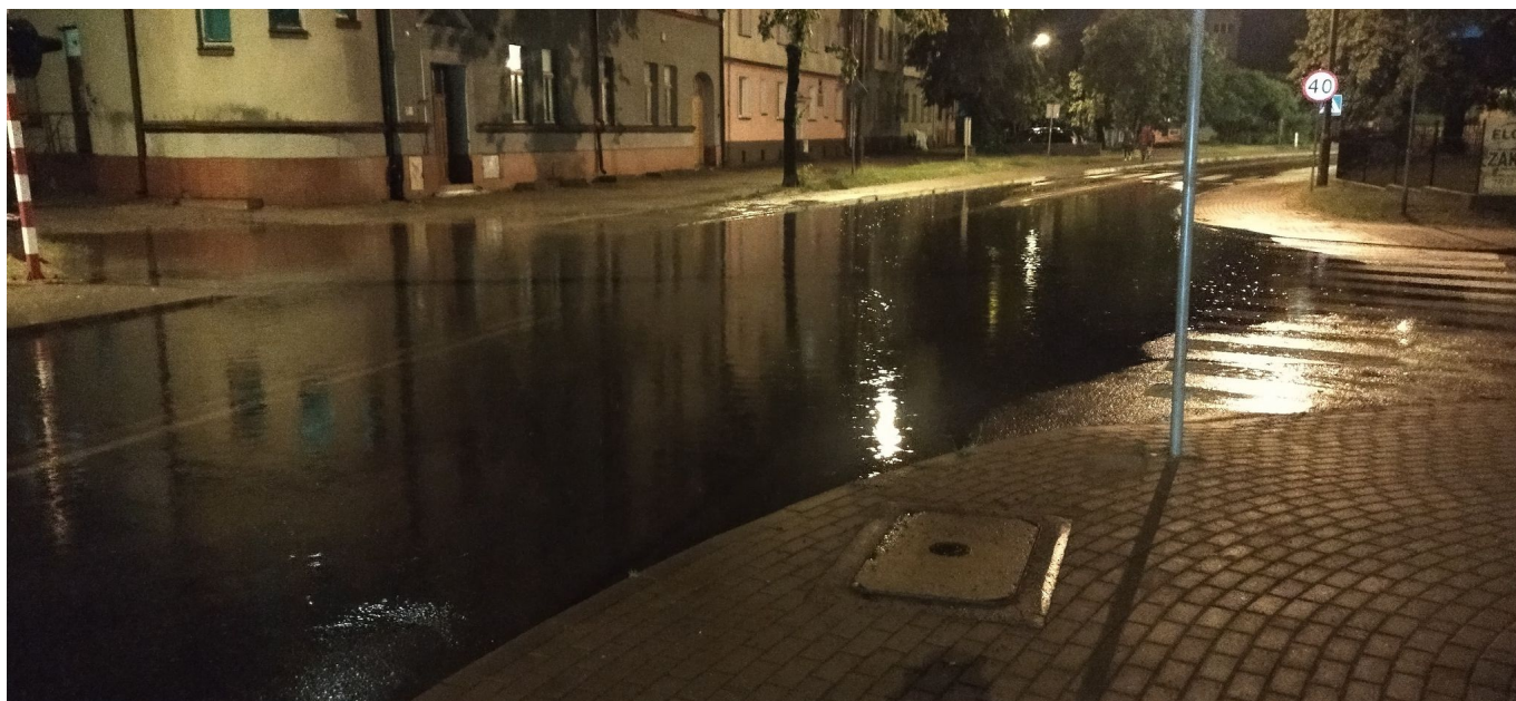
Na tym zdjęciu zalana ulica Szeptyckiego, niedaleko ul. Kościuszki.