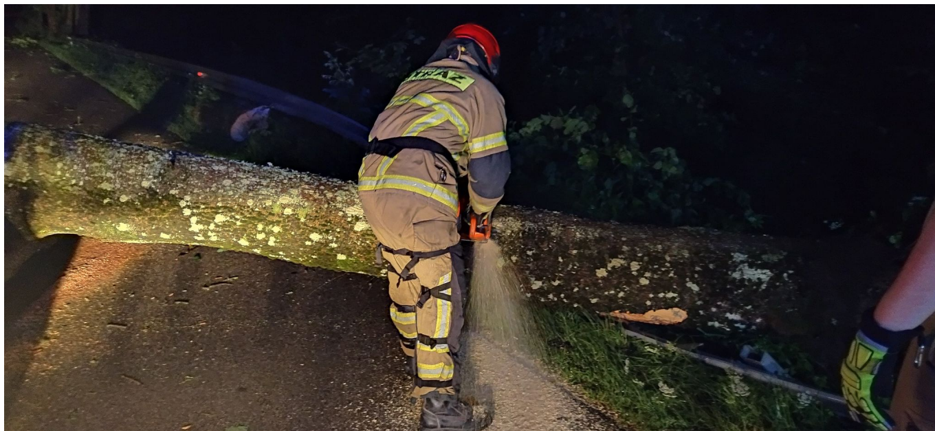
Ewakuacja uczestników obozu harcerskiego, to jedna z najważniejszych interwencji strażaków.