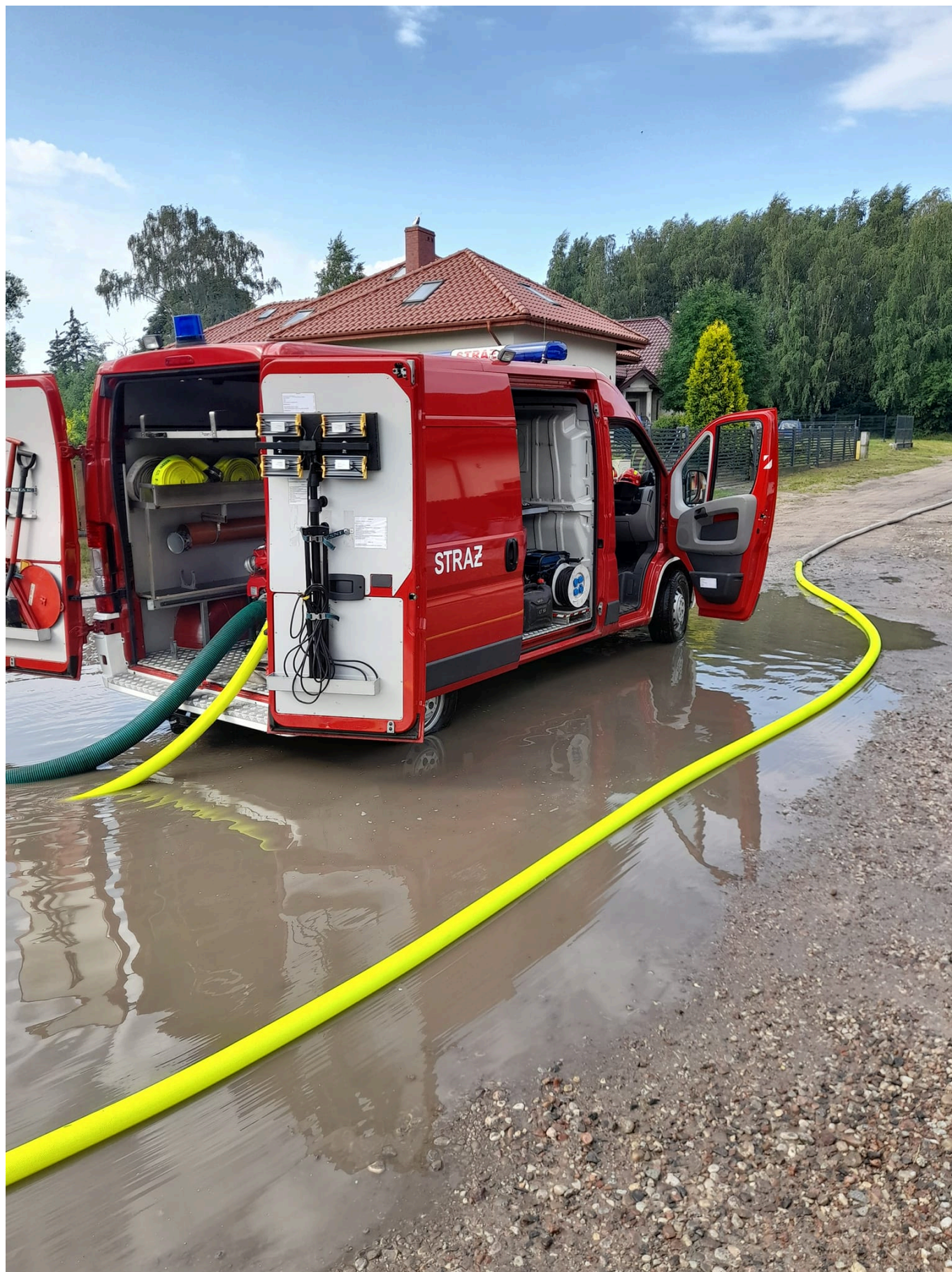
Powalone drzewa i konary. Strażacy, jadąc na interwencje, musieli torować sobie drogę.