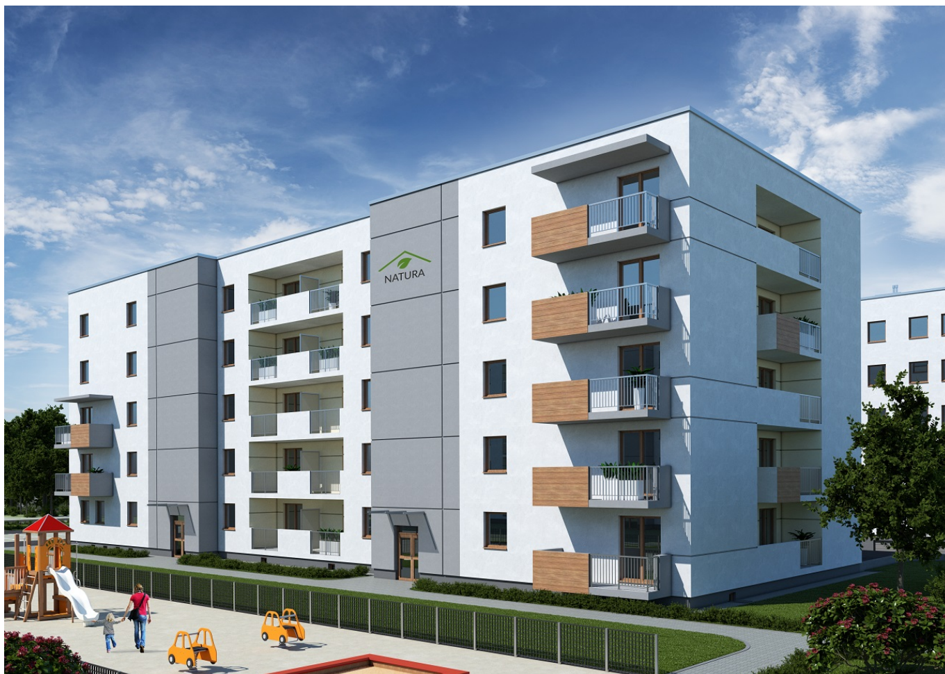
Akcenty natury w częściach wspólnych w budynku nr P1.